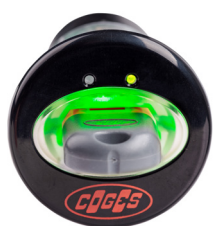
Lector de llaves Key

Un sistema de pago cashless de llave o tarjeta se puede conectar al bus MDB del monedero de cambio Aeterna, para obtener todas las ventajas de una solución integrada para la gestión del cambio y del cashless.